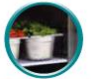
Grilles sur glissières