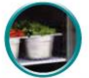
Grilles sur glissières