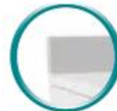
Dossieret H 100 mm