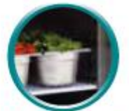
Grilles sur glissières