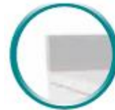
Dosseret H 100 mm