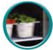
Grilles sur glissières