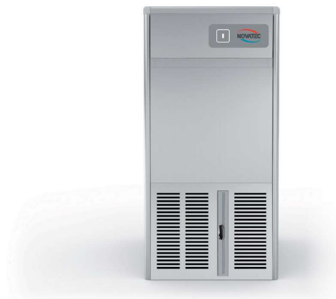
NOVA ICE Creux 20 AS/WS