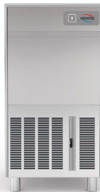
NOVA ICE Creux 50 AS/WS