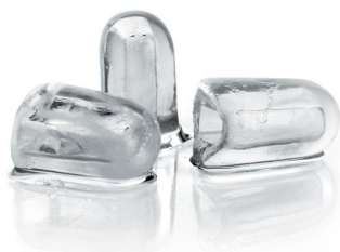
Glaçons « Creux de 21gr »