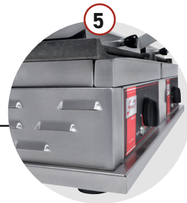
UNE IMPORTANTE JUPE POUR UNE SÉCURITÉ MAXIMALE