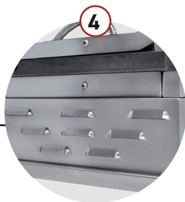
OUIES EN FORME DE V PERMETTANT UNE CIRCULATION PARFAITE DE L'AIR